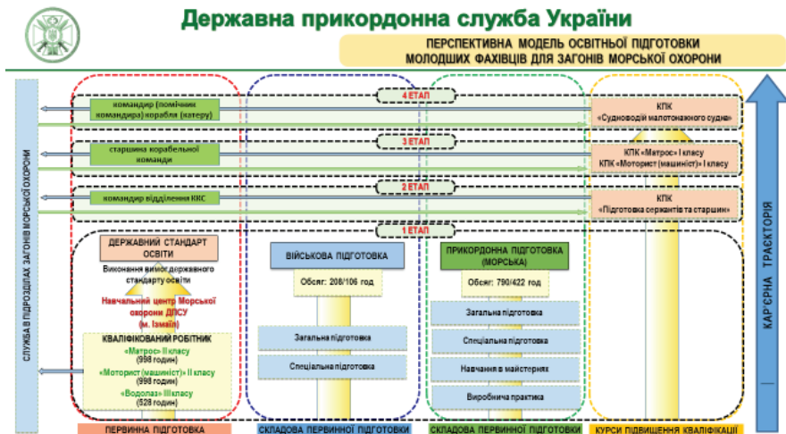
Рис. 3. Перспективна модель освітньої підготовки молодших фахівців для загонів морської охорони в Навчальному центрі Морської охорони