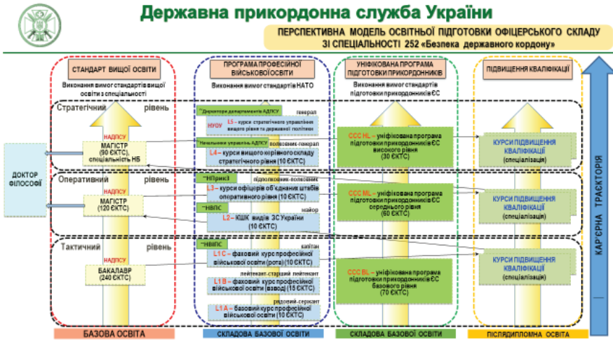
Рис. 1. Перспективна модель освітньої підготовки офіцерського складу зі спеціальності 252 "Безпека державного кордону"