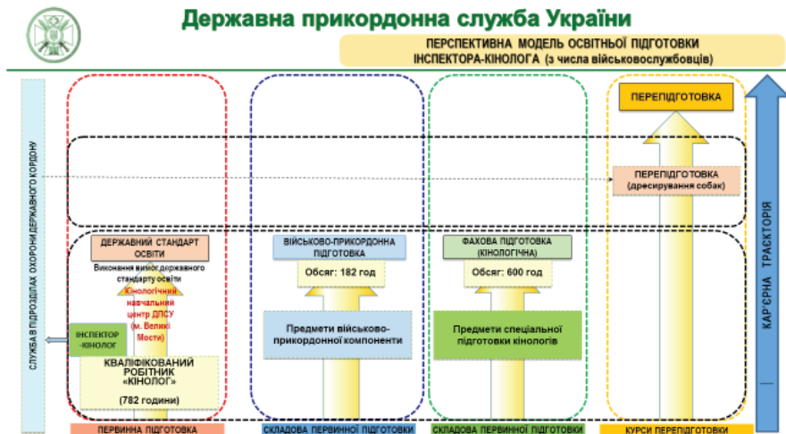
Рис. 4. Перспективна модель освітньої підготовки інспектора-кінолога в Кінологічному навчальному центрі